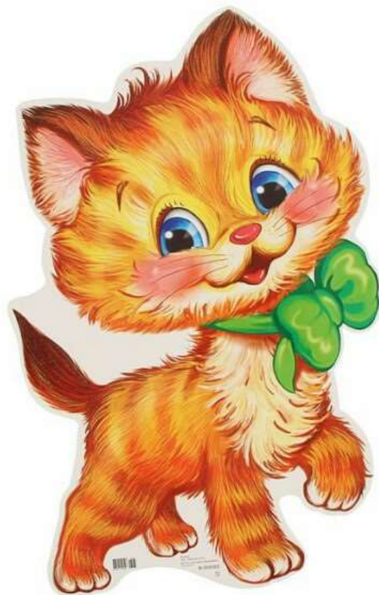
Котёнок («Усатый полосатый»)