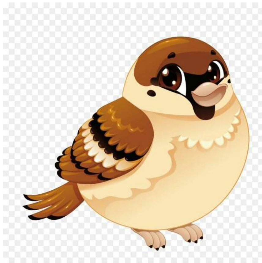
Воробей («Где обедал воробей»)