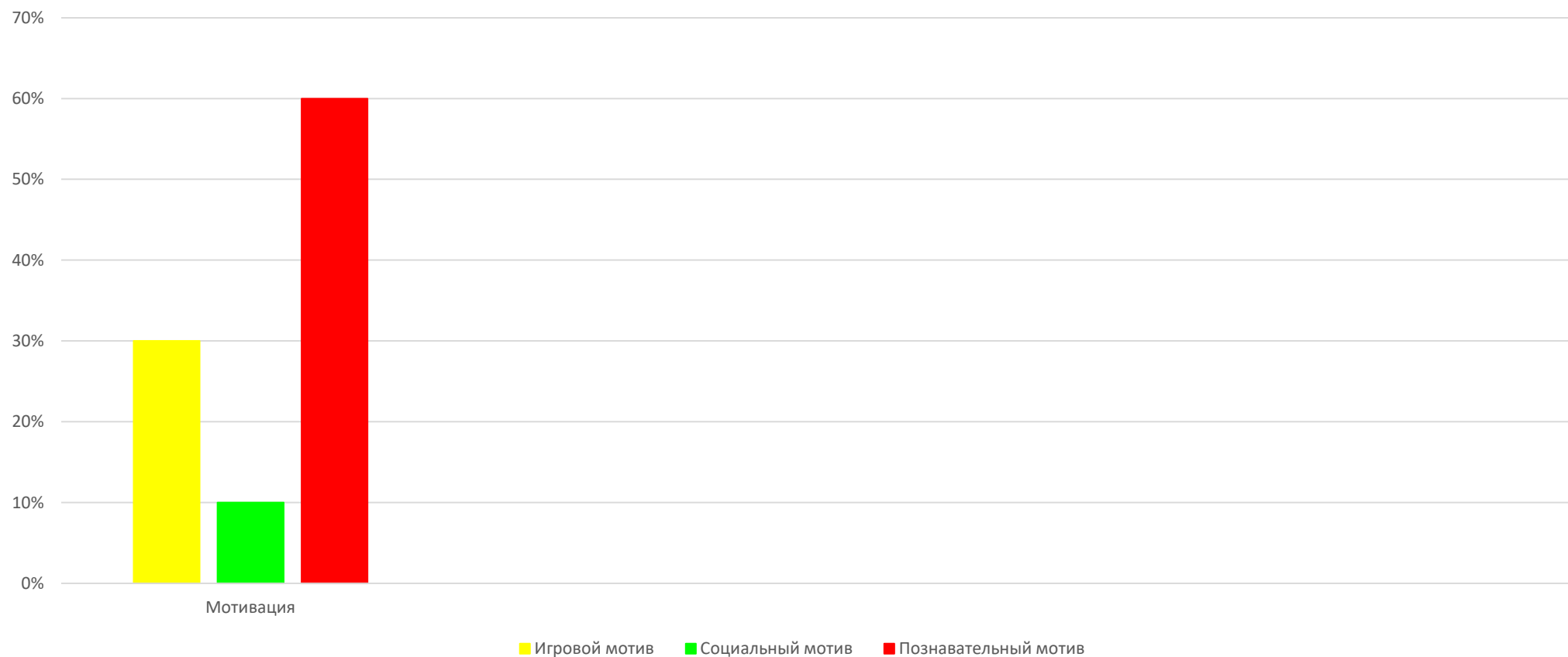
Мотивационная готовность к школе